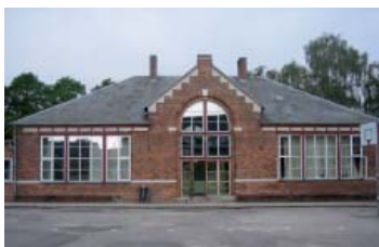
En af de gamle bevaringsværdige klassefløje fra 1901