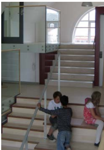
Siddetrappe i nyt dobbelthøjt fællesområde