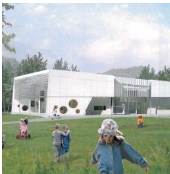
Børnehaveklynge set fra legepladsen