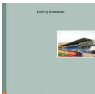
Fritids- og idrætsområdet - Alle kommunale og selvejende haller, udeanlæg mv.