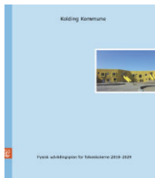
Folkeskolerne - 29 folke- og specialskoler

Udviklingsplanerne for folkeskolerne, børneområdet og fritids- og idrætsområdet er vedtaget som sektorplaner i kommunen, mens tegnestuen har videreført udviklingsplanen for sundhedsområdet til egentligt byggeprogram for nyt sundhedscenter.