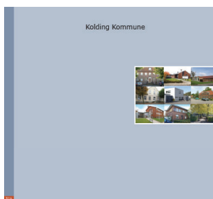
Socialområdet - 38 institutioner og bosteder